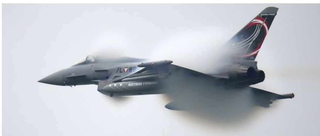
Die 7LWB der österreichischen Luftstreitkräfte mit „Sonderbemalung“ während des Displays

Aber auch bis jetzt hat sich einiges getan. Am 06. u. 07.09. fand am Fliegerhorst in ZELTWEG die AIRPOWER 19 des Österreichischen Bundesheeres mit Beteiligung des Landes Steiermark und RED BULL statt. Trotz des eher durchwachsenen Wetters verfolgten an beiden Tagen wieder fast 200.000 Besucher die größte Airshow in Mitteleuropa.