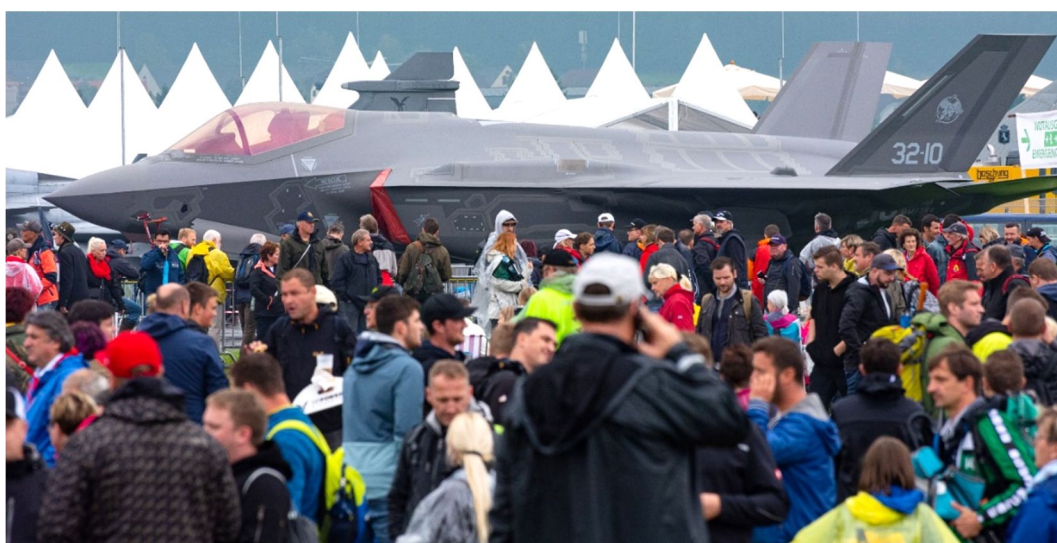
Static AIRPOWER19 mit F35

Mehr dazu, viele Fotos und Filme gibt es auf der Homepage des Österreichischen Bundesheeres www.bundesheer.at oder unserer Homepage www.luftstreitkraefte.at .