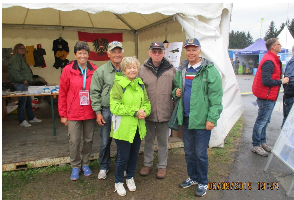
Unsere fleißigen Helfer mit Besucher der AIRPOWER19

Auch hier waren wir wieder mit einem Informationsstand, diesmal gleich neben dem Luftfahrtmuseum, präsent. Dank des großen Teams von 12 Mitarbeitern fand sich auch Zeit das fantastische Programm zu bewundern und die außergewöhnliche Static zu begutachten.